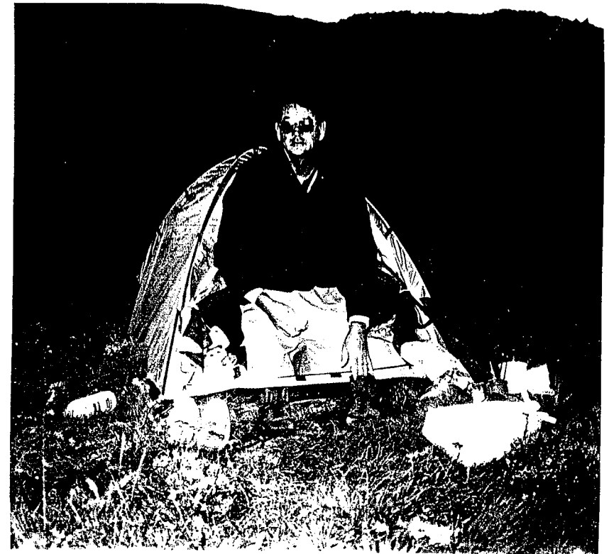
'n Meerkat wat uit sy gat loer? ... of ... Allan Smuts wat uit sy tent loer?!

deur nie rotse af te rol, klippe te gooi, radio's of bandopnemers te speel, te skreeu of ongemanierd op te tree nie.