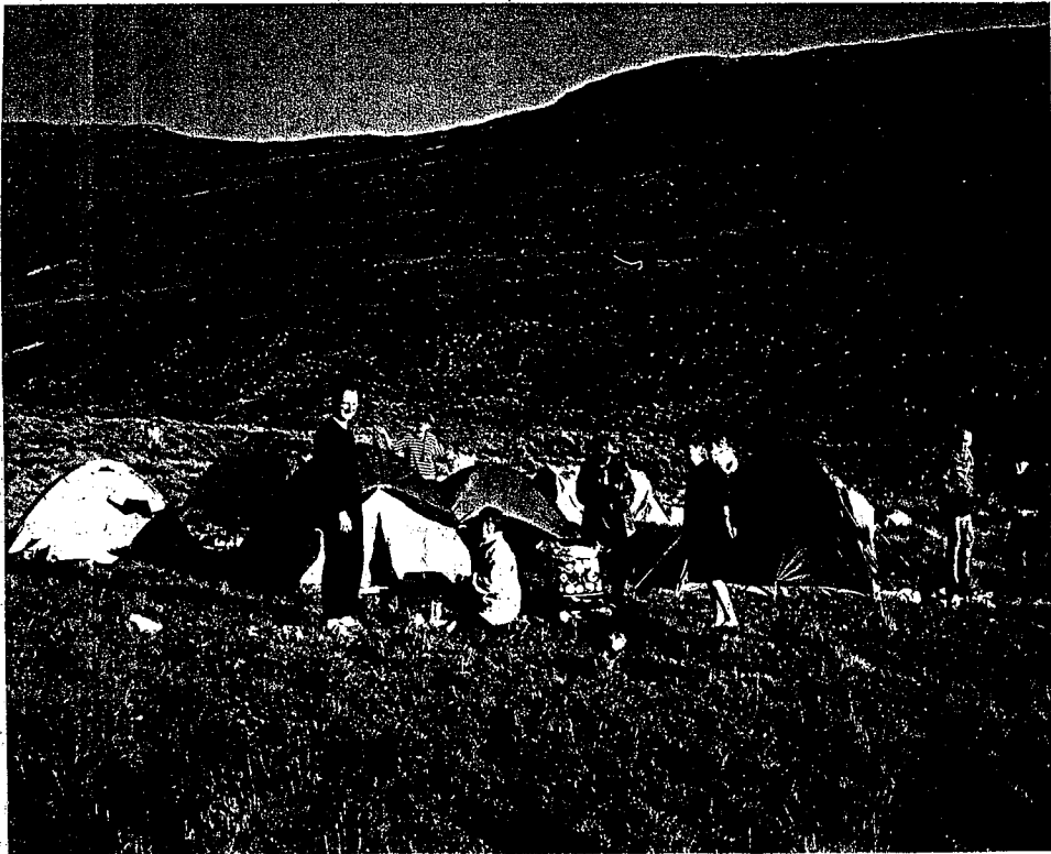
"Tente-dorp" bo-op die Drakensberge

harde klippe onder ons lywe? Die klein bietjie water waarin jy gewas het. Jy wat gewas het. Onthou julle die lekker gesels uit die verskillende tente? Ja, onthou julle die gesoek na die regte paadjie daar teen die einde? Die warm stort en ten spyte van die rou geskaafde nerwe die gevoel van samehorigheid toe ons vir oulaas 'n kring maak en Sy Naam aanroep. Ja, onthou jy nog?!