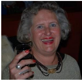
LIEF EN LEED