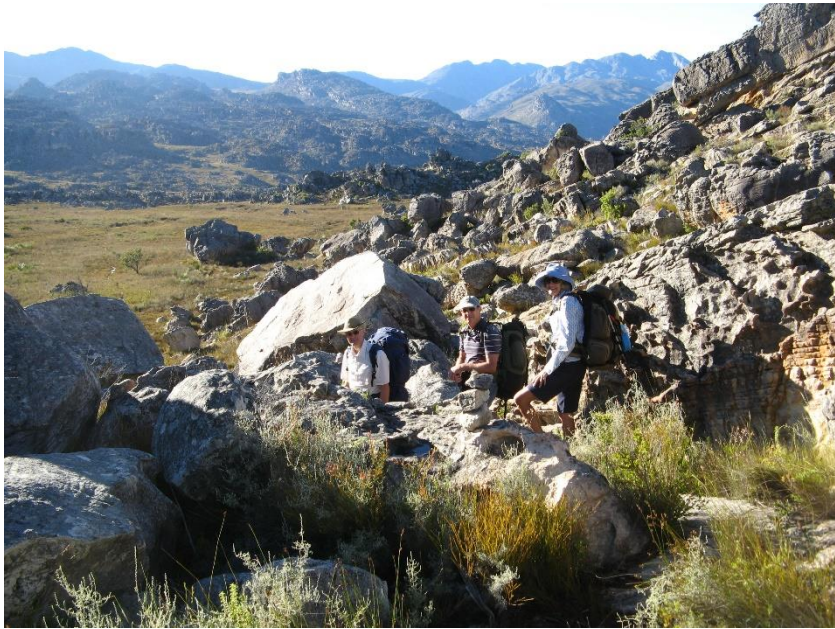
GROOT WINTERHOEK BERGE