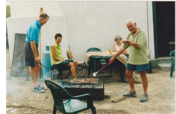
Ons het gehelp om stappaie oop te kap. Tierkop se afrondingswerk nadat die hut oor gebou is. Coastal cleanup ens.